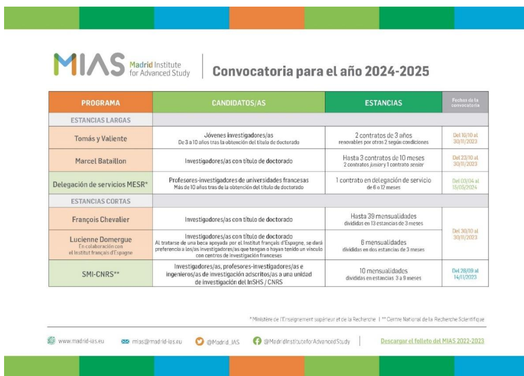
Figura 1: Tabla resumen de las convocatorias ofertadas por el MIAS para la selección de los investigadores del curso académico 2024-2025.

La convocatoria Tomás y Valiente, iniciada en el curso 2017-18, acoge a investigadores con una destacada trayectoria investigadora en instituciones distintas a la UAM, cuyos proyectos de investigación requieran una residencia en Madrid por un período inicial de tres años, con posibilidad de renovación por dos años adicionales. Durante este periodo, los investigadores seleccionados se incorporan en el departamento correspondiente de la UAM. El propósito de este programa es atraer talento investigador a áreas menos privilegiadas por el Programa Ramón y Cajal en la UAM. De esta forma, se compromete a ofrecer estabilidad a los candidatos seleccionados tras una evaluación positiva de la actividad desarrollada durante los 5 años de contrato, facilitando la incorporación de investigadores de renombre internacional a la UAM.