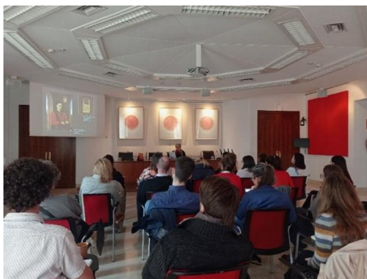
Figura 4: Imagen de uno de los seminarios celebrados en la sala Pierre Paris de Casa de Velázquez.

Aprovechando estos espacios de la UAM y de Casa de Velázquez, los investigadores realizan un seminario durante su periodo de estancia [Figura 4], en el que comparten aspectos de su investigación con la comunidad del MIAS.