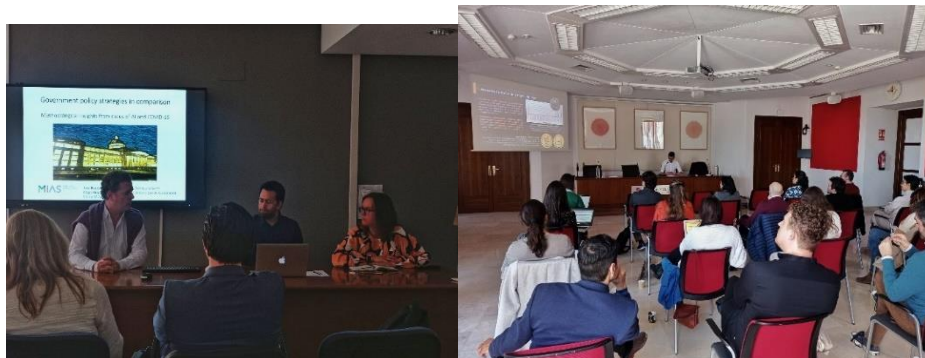
Figuras 5 y 6: Imágenes de dos seminarios, celebrados en la Facultad de Derecho de la Universidad Autónoma de Madrid y en la Sala Pierre Paris de Casa de Velázquez, respectivamente.

El objetivo de los seminarios es que cada miembro del MIAS pueda compartir con los demás su investigación, generándose debates interesantes, así como un momento de encuentro que resulta muy provechoso.