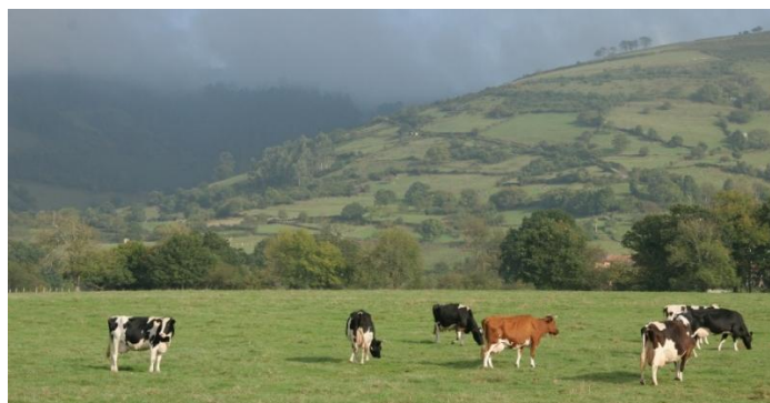
Figura 5. SERIDA, Granja Demo Samielles, Villaviciosa.

Además, se prestan servicios especializados para el análisis de la composición y el valor nutritivo de prados, praderas, cultivos forrajeros y de las principales materias primas destinadas a la alimentación animal. Estos trabajos se realizan en un laboratorio acreditado por ENAC (acreditación LE/930), garantizando la fiabilidad y validez de los resultados analíticos.