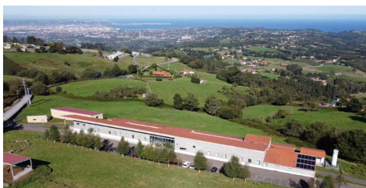
Figura 2. SERIDA, Centro de Biotecnología Animal, Granja Demo Deva, Gijón.

La actividad investigadora del área aborda asimismo otras líneas de trabajo, entre las que destacan el estudio de biomarcadores de detección precoz de la paratuberculosis bovina y de hospedadores tolerantes a la enfermedad, la identificación y caracterización de virus emergentes y patógenos zoonóticos, así como el estudio de la fauna silvestre como potencial reservorio de patógenos animales y humanos.