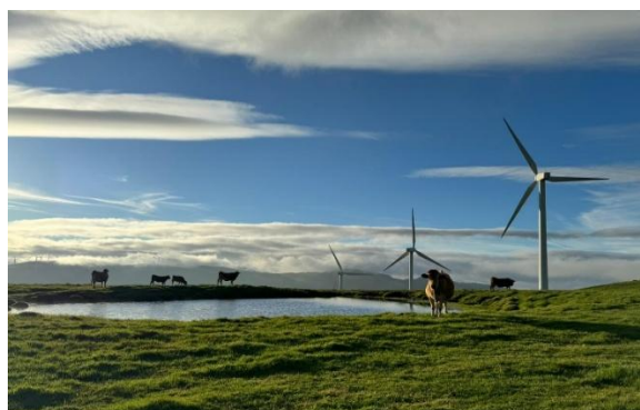
Figura 4. SERIDA, Finca Experimental, Granja-Demo El Carbayal, Illano.

Sus líneas de trabajo abordan: 1) la gestión sostenible de los recursos pastables con ganado (vacuno, ovino, caprino y equino), especialmente en zonas desfavorecidas y de montaña, para garantizar la sostenibilidad, la diversificación de la producción y la preservación de la biodiversidad y las estrategias de manejo de pastoreo apoyadas en Tecnologías de la Información Geográfica, 2) el efecto del bienestar animal y del manejo postsacrificio de las canales sobre la calidad sensorial del producto final, y 3) la identificación de biomarcadores moleculares de calidad de la carne aplicados a la clasificación de canales y piezas, para reducir las pérdidas económicas y el desperdicio alimentario.