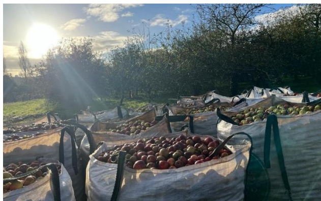
Figura 7. SERIDA, Banco de Germoplasma de manzano, Villaviciosa.

El Banco de Germoplasma de Manzano (803 entradas) reúne una amplia representación de variedades locales de Asturias y del País Vasco y dispone de una representación de variedades de Galicia y del nordeste de España, pero también de variedades foráneas de diversos orígenes, incluidas variedades de manzano de sidra de Francia e Inglaterra, siendo una de las colecciones de referencia del Arco Atlántico. Acoge tanto entradas de manzano de sidra como de mesa y material de otras especies del género Malus .