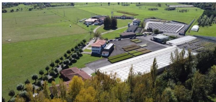
Figura 6. SERIDA, Finca Experimental, Granja-Demo La Mata, Grado.

El área de Cultivos Hortofrutícolas y Forestales concentra su actividad investigadora en la mejora de las producciones hortícolas, frutícolas y forestales del Principado de Asturias. Para ello desarrolla cuatro programas de investigación: Genética Vegetal, Patología Vegetal, Fruticultura e Investigación Forestal, que permiten abordar de manera integral los retos del sector.