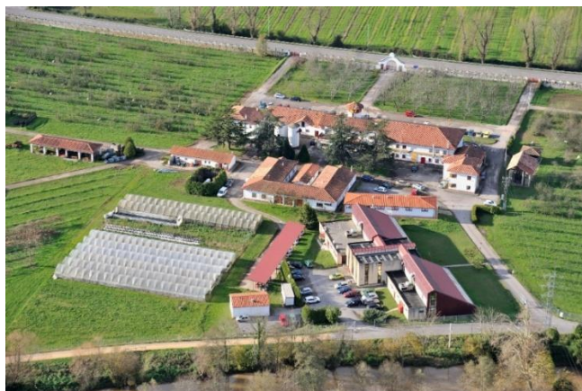
Figura 1. SERIDA, sede central, Villaviciosa.

Para el desarrollo de su actividad, el SERIDA dispone de varios centros y Granjas Demo, distribuidas en los municipios asturianos de Villaviciosa, Gijón, Grado e Illano. Las Granjas Demo constituyen una red de seis estaciones experimentales, localizadas en ubicaciones con distintas condiciones edafoclimáticas y ecosistémicas, que se ofrecen para la realización de actividades de I+D y demostrativas. Cuentan con fincas y rebaños y se complementan con invernaderos, cámaras de cultivo y laboratorios dotados de equipamientos científico-técnicos avanzados en el ámbito de la reproducción animal, la sanidad animal, fisiología y patología vegetal, genómica y proteómica, tecnología y calidad de los alimentos para la nutrición animal y humana.