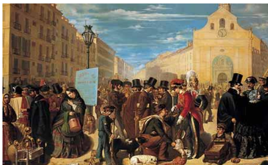
Madrid, mosaico de clases

Aquel Madrid era un enorme Babel de clases. El “tamaño familiar” de la capital y su indefinición propiciaron que los miembros de todos los escalafones se encontrasen y conviviesen más a menudo que en otras capitales europeas de mayor tamaño y definición. En tal ambiente, el clasismo se aceptaba con total naturalidad. La clase baja estaba compuesta por menestrales, obreros y servidores, mientras que pobres, vagos y ociosos se congregaban en torno a la Puerta del Sol y al mercado de las Vistillas.