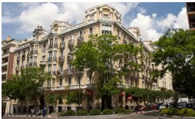
Un barrio para ricos

El caso es que el marqués de Salamanca acabó por arruinarse con su proyecto. Si se analiza su estrategia inversora y se observan sus decisiones, es fácil darse cuenta de que él mismo fue causante y víctima de la ola especuladora que lo llevó a la ruina. Y es que tardó muchísimo tiempo en entrar en el mercado, al que llegó en la década de los sesenta. Además, compró a precio excesivamente revalorizado y lo hizo de forma rápida, sin apenas negociar, en su ansia de que nadie se le adelantase en el desarrollo del eje “Recoletos-Castellana”, que era el que le interesaba. Así que, con este comportamiento,