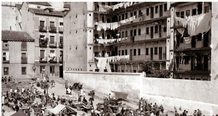
La corrala: hacinados pero menos

Hasta el momento, se ejercía una segregación socio espacial en altura. Es decir, las distintas clases sociales convivían en un mismo edificio, en el que las plantas superiores estaban ocupadas por las clases más desfavorecidas. Así que tener que el hecho de tener que subir más o menos escaleras influía en el precio del alquiler. Algo que contribuirá a que esto cambie será la aparición del ascensor. El primero que tuvo Madrid era hidráulico y se colocó en 1877 en la finca situada en el número 122 de la Calle Mayor.