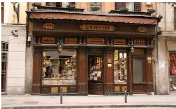
Lhardy, buque insignia de la gastronomía madrileña

Son tiempos en los que había grandes diferencias entre la dieta que consumían las clases con suficiente poder adquisitivo y la que se servía en las mesas de las capas más humildes de la población. Sabemos que el abasto del pescado era problemático, ya que el servicio de diligencias destinado a su transporte tardar cinco días en llegar a Madrid. De ahí la importancia que tenía el consumo de bacalao.