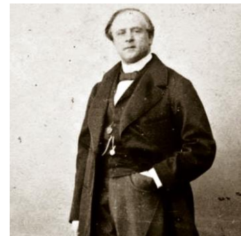
El Marqués de Salamanca