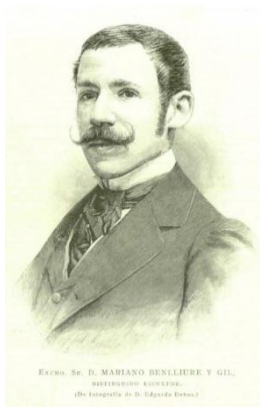
Benlliure, un ilustre cliente de Lhardy