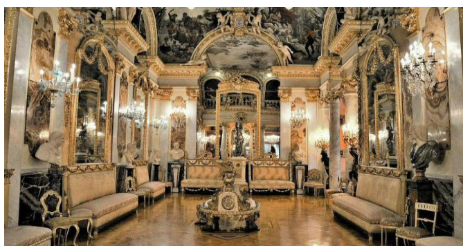
La opulencia en casa

Pero no siempre las historias acaban bien. En 1869, el marqués de Salamanca quiebra. Malvenderá sus inmuebles o los ofrecerá como fianza para nuevos préstamos. Y no dejará de presionar al Consistorio para conseguir tratos de favor. Como si fuera una broma del destino, justo en ese año de ruina para Salamanca, el Ayuntamiento decide otorgar su nombre al barrio.