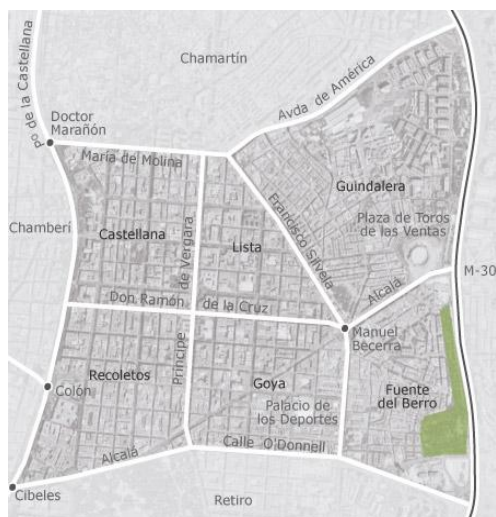
El Barrio de Salamanca

Mesonero Romanos hace referencia a la situación en su romance titulado El nuevo Madrid . Dice así: