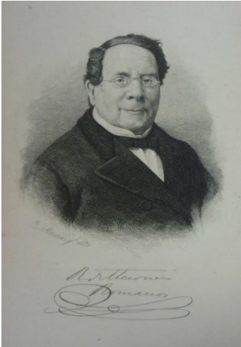
Mesonero Romanos, el especulador silencioso

Fue el primer restaurante de Madrid al que podían acudir las mujeres solas y donde siempre había agua fría. No olvidemos que en este momento que no existían las neveras. L'Hardy fue capaz de conseguirlo, dado que tenía un pozo de nieve en el sótano.