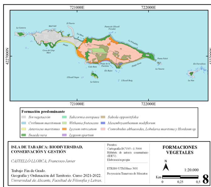
Figura 3: Formaciones vegetales de la isla.

En cuanto a la flora, la acción antrópica ha favorecido la distribución de plantas exóticas usadas en jardinería, como Carpobrotus edulis , Nicotiana glauca y Oxalis pes-caprae (Castelló, 2022). Específicamente, Carpobrotus edulis ha colonizado gran parte del territorio y acantilados, desplazando a especies nativas vulnerables como Limonium sp. y Lavatera mauritanica (Gurevitch y Padilla, 2004; Castelló, 2022). El mapa de vegetación (Figura 3) revela una correlación directa: las áreas con mayor tránsito turístico presentan una menor densidad de flora autóctona (Castelló, 2022; García, 2025).