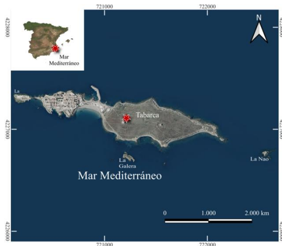
Figura 1. Situación geográfica de la Isla de Tabarca (Alicante, España). Elaboración propia.

una población censada de 49 residentes (INE, 2023). Sus singulares cualidades le han otorgado múltiples figuras de protección legal: su núcleo urbano fue declarado Conjunto Histórico-Artístico en 1964 y, en 1986, sus aguas se convirtieron en la primera Reserva Marina de España (Figura 2). Además, forma parte de la Red Natura 2000 como zona ZEPA y LIC, protegiendo especies vulnerables como la gaviota de Audouin o el cormorán moñudo, así como las extensas praderas de Posidonia oceanica (MITECO, 2015; CPAGE, 2025).