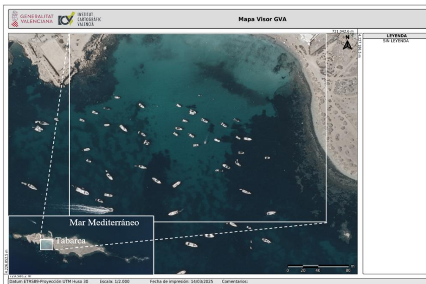
Figura 4. Zonas sin fanerógamas, asociada al fondeo de los barcos.

El fondeo incontrolado de embarcaciones recreativas sobre las praderas de Posidonia oceanica causa una regresión directa de este hábitat esencial para la oxigenación y estabilidad del fondo (Box et al., 2008; García-Gómez, 2021; Figura 4). También se añade que los motores en zonas poco profundas aumentan la turbidez del agua, dificultando la fotosíntesis de las fanerógamas (Ruiz y Romero, 2003; Carreño y Lloret, 2021). Cabe resaltar que el transporte marítimo contribuye a la acidificación local por emisiones de NOx y SOx y, a la acumulación de hidrocarburos aromáticos policíclicos (HAP) en organismos marinos, lo que genera daños genéticos y toxicidad celular (Cavallo et al., 2006; Turner et al., 2018; Carreño y Lloret, 2021). Asimismo, se han documentado colisiones físicas con especies protegidas como la tortuga boba o el pez luna, accidentes que incrementan su frecuencia durante el verano (Canales-Cáceres et al., 2023; Carreño y Lloret, 2021).