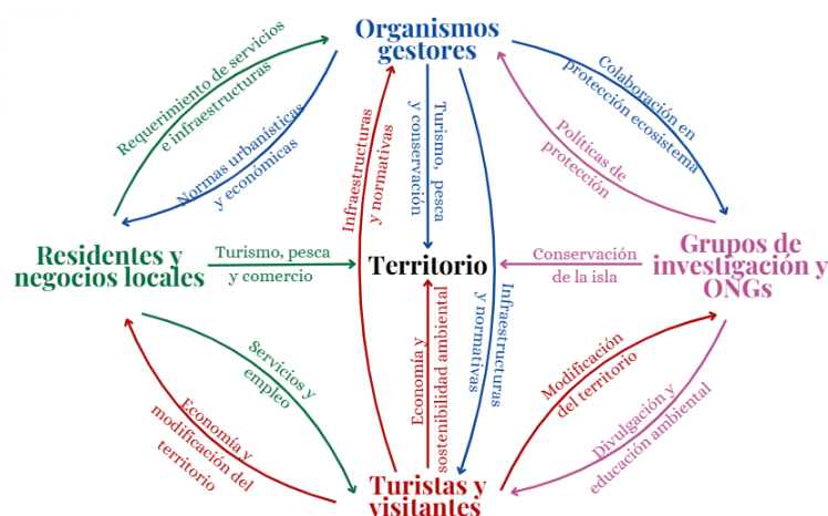
Figura 5. Interacciones de los agentes que actúan en la isla de Tabarca.