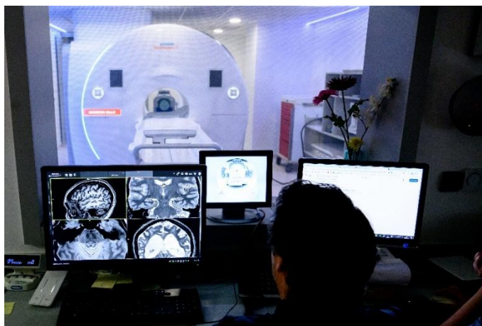
Imagen 3. Cada año, los residentes del CAFRS donan una muestra de sangre y se someten a una exploración cerebral utilizando el equipo de Resonancia Magnética 3T MAGNETOM Cima.X del Centro.

Estos resultados reflejan la fortaleza del enfoque integrador de la fundación, en el que la investigación clínica y la atención directa se retroalimentan, generando conocimiento que puede aplicarse directamente a la práctica médica y a la mejora de la calidad de vida de los pacientes.