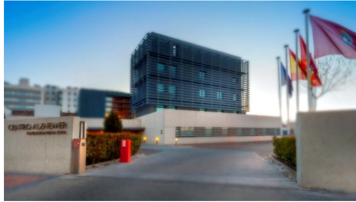
Imagen 1. El edificio del Centro de Investigación de Enfermedades Neurológicas, CIEN, que se erige en la imagen, está integrado en el Centro Alzheimer Fundación Reina Sofía (CAFRS).